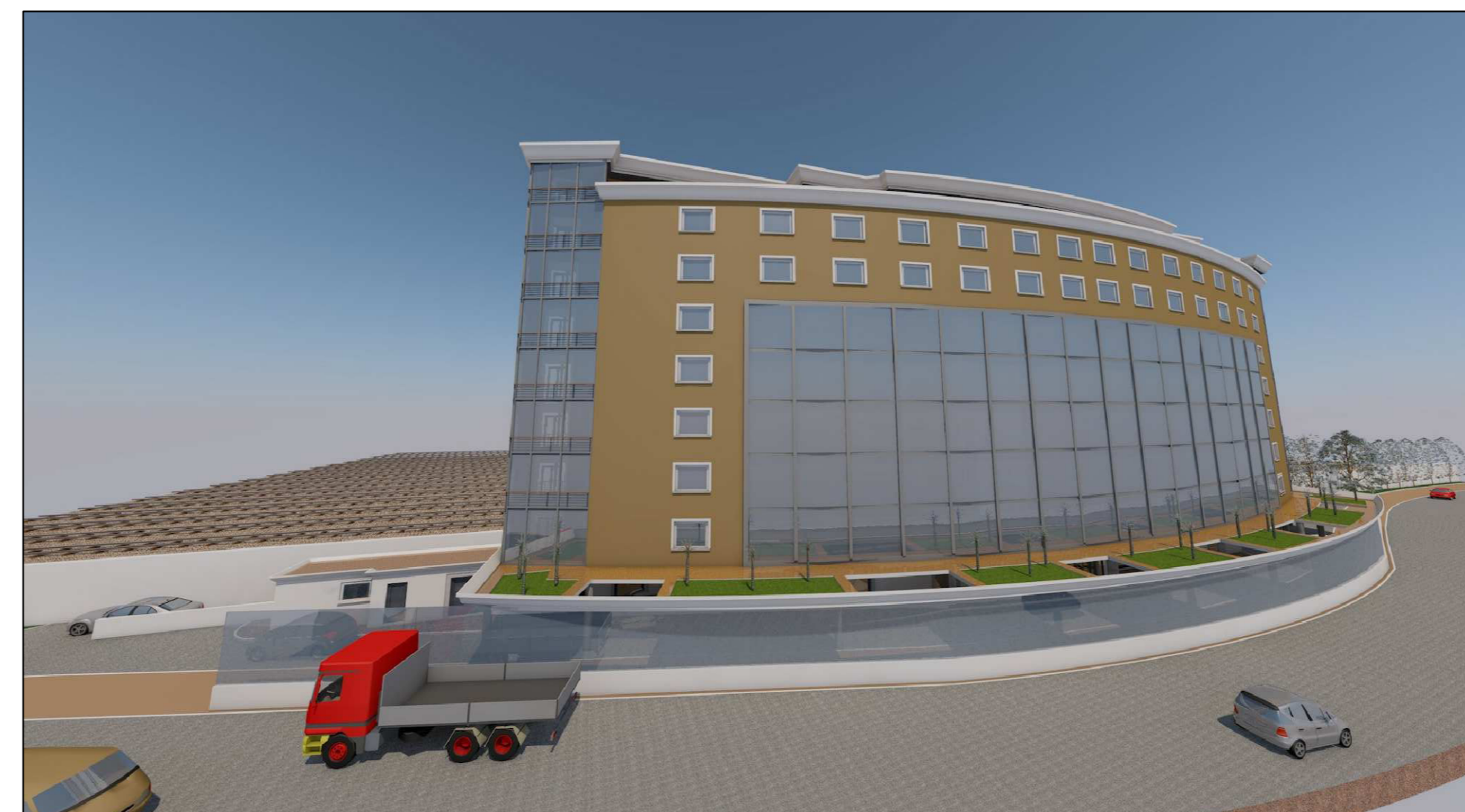
Vista n° 1