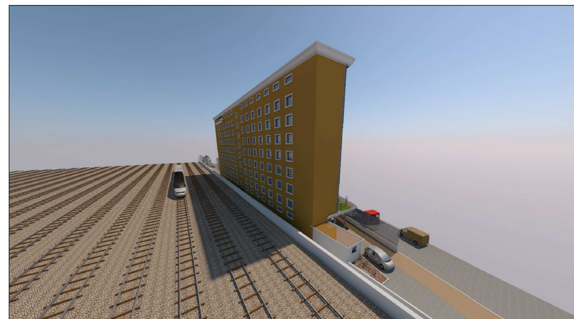
Vista n° 2