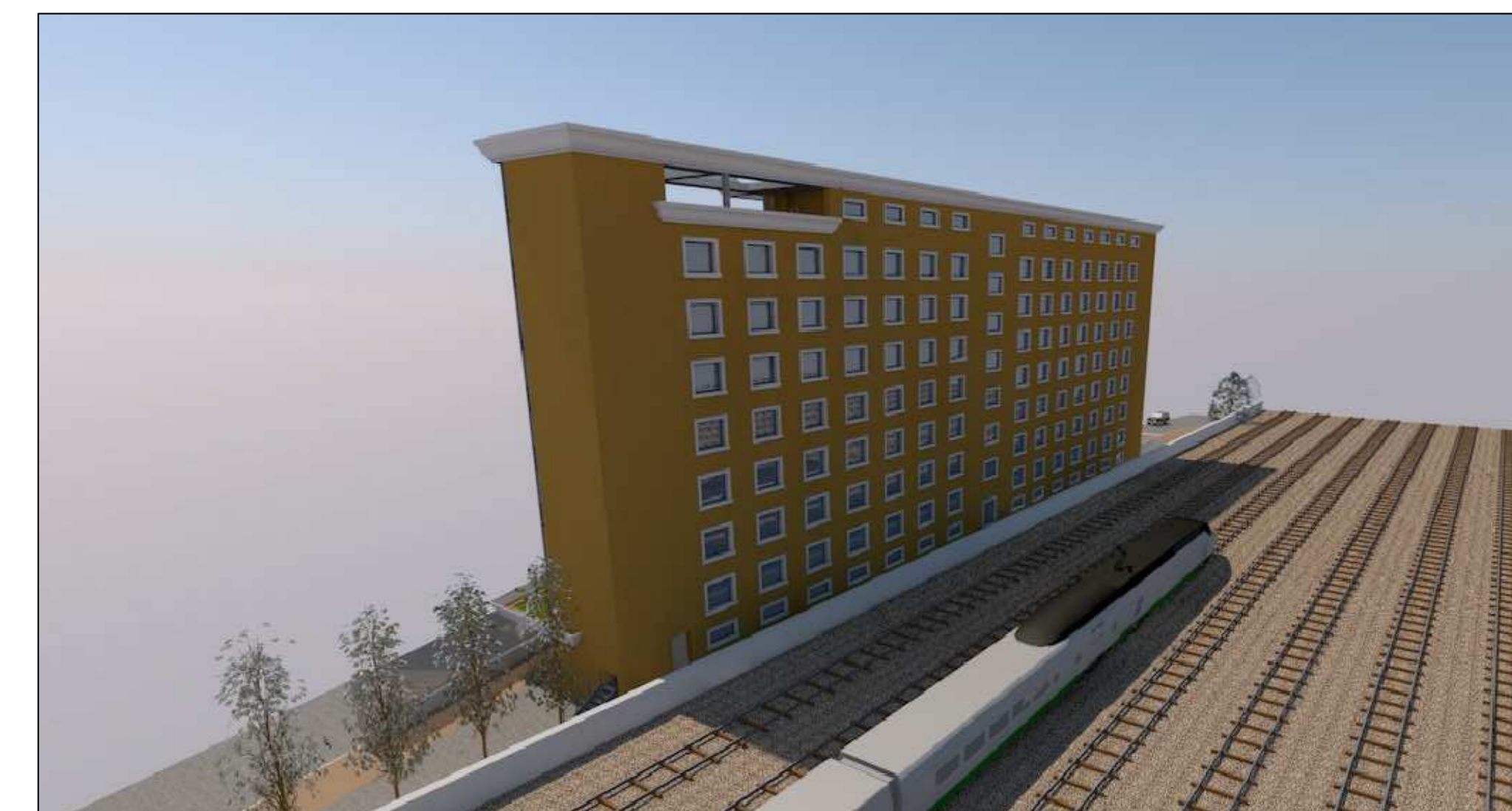
Vista n° 4