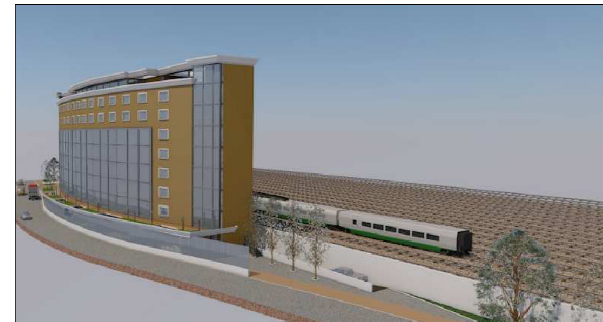
Vista n° 3